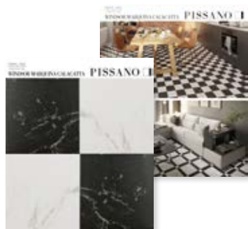
Panel expositor sobremesa 31x36 cm.