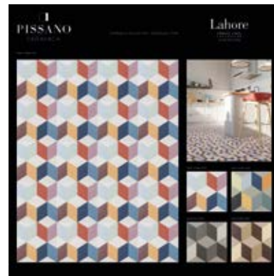
Bandejas de 100.5x100.5 cm.