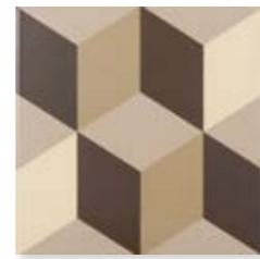
Lahore Coffee 15x15 cm. 5 29 /32" x 5 29 /32" C1515