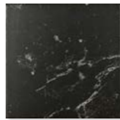
Windsor Marquina* 15x15 cm. 5 29 /32" x 5 29 /32" C1515