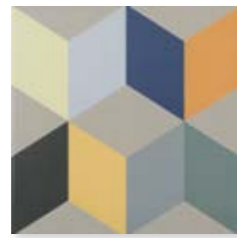
Lahore Yellow 15x15 cm. 5 29 /32" x 5 29 /32" C1515