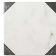
Windsor Octogono* 15x15 cm. 5 29 /32" x 5 29 /32" C1515