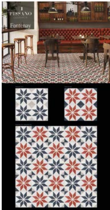
Paneles 192.4x100.5 cm.