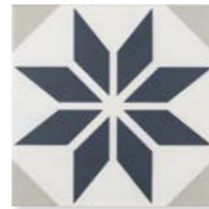
Fontenay Blue 15x15 cm. 5 29 /32" x 5 29 /32" C1515