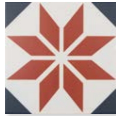
Fontenay Red 15x15 cm. 5 29 /32" x 5 29 /32" C1515