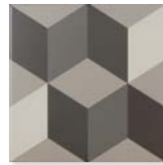
Lahore Grey 15x15 cm. 5 29 /32" x 5 29 /32" C1515