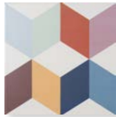
Lahore Vintage 15x15 cm. 5 29 /32" x 5 29 /32" C1515