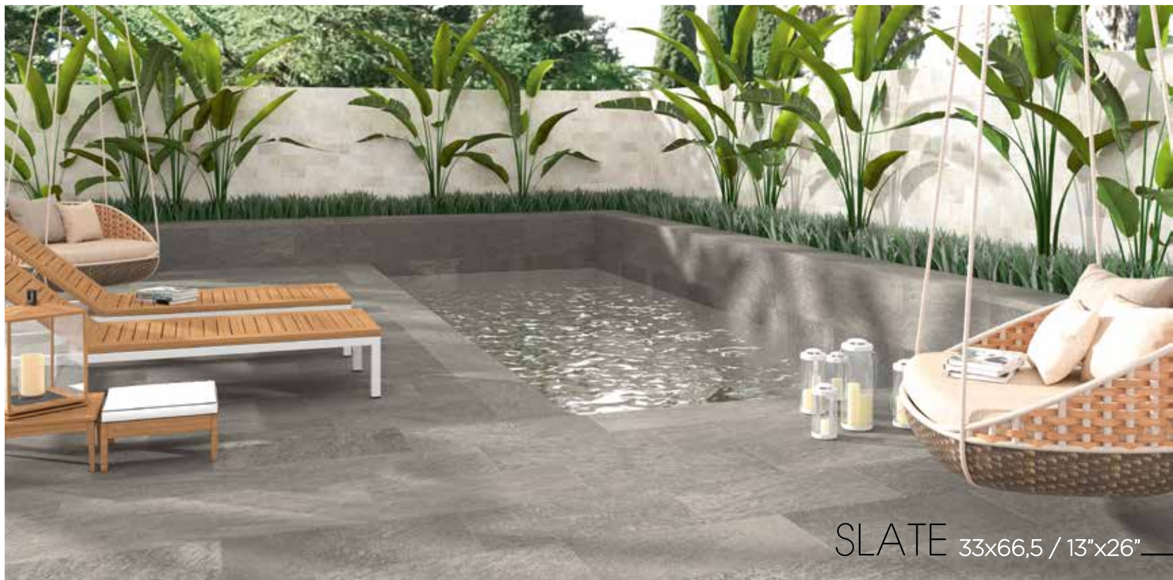
SLATE 33x66,5 / 13"x26"