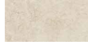
OXFORD PURE 33x66,5 / 13"x26" T35/M