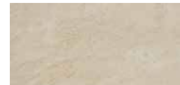
OXFORD ASHEN 33x66,5 / 13"x26" T35/M