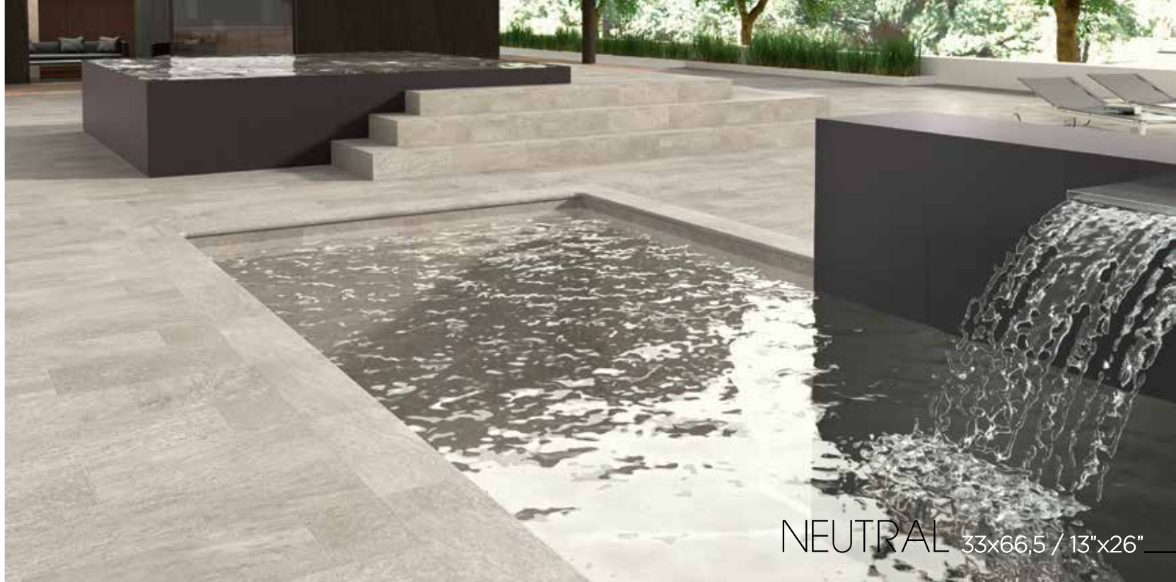
NEUTRAL 33x66,5 / 13"x26"