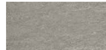
OXFORD SLATE 33x66,5 / 13"x26" T35/M