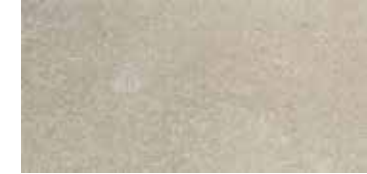
OXFORD NEUTRAL 33x66,5 / 13"x26" T35/M