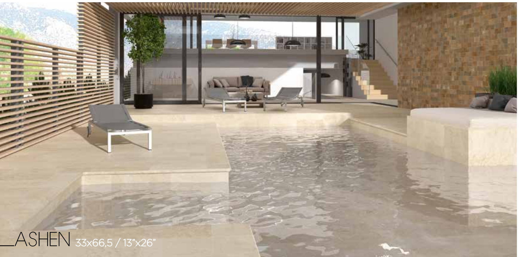
ASHEN 33x66,5 / 13"x26"

PELDAÑO RECTO OXFORD ASHEN 33x33x3 / 13"x13"x1" B07/P