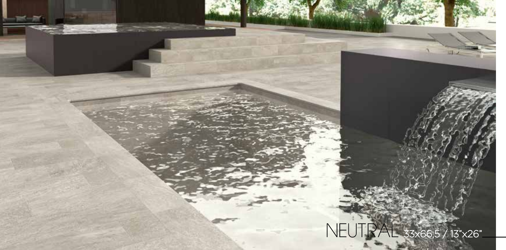
NEUTRAL 33x66,5 / 13"x26"