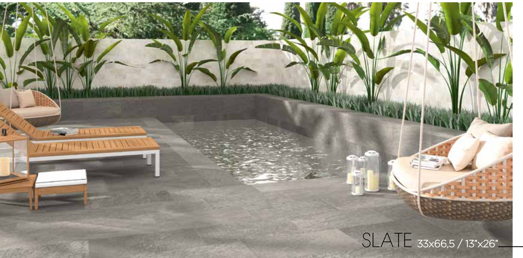
SLATE 33x66,5 / 13"x26"