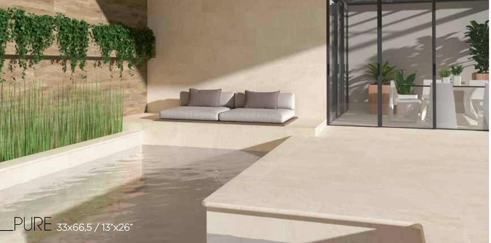
PURE 33x66,5 / 13"x26"

PELDAÑO RECTO OXFORD PURE 33x33x3 / 13"x13"x1" B07/P